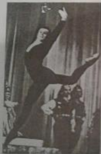
ՀՀ ժող. արտիստ Վիլեն Գալստյան