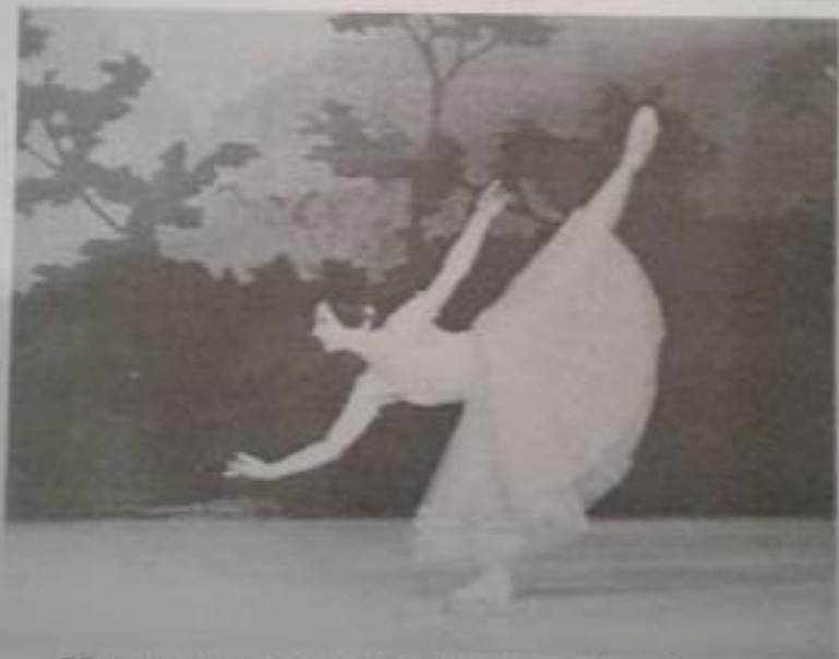
ԳԳ վաստակավոր արտիստուհի Նադեժդա Ղալիբյան