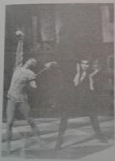
ՀՀ վաստ. արտիստ Նորայր Մեհրաբյան, Ալբերտ Անդրեասյան