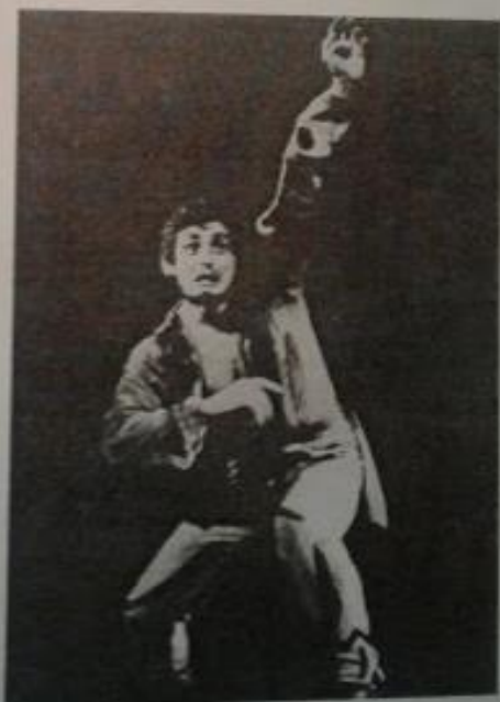
ՀՀ ժող. արտիստ Վանուշ Խանամիրյան