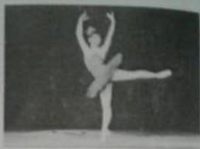
ՀՀ ժող. արտիստուհի Էլվիրա Սնազանյան