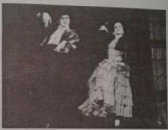
ՀՀ ժող. արտիստուհի Բելլա Հովնանյան ՀՀ վաստ. արտիստ Ռուդոլֆ Խատատյան