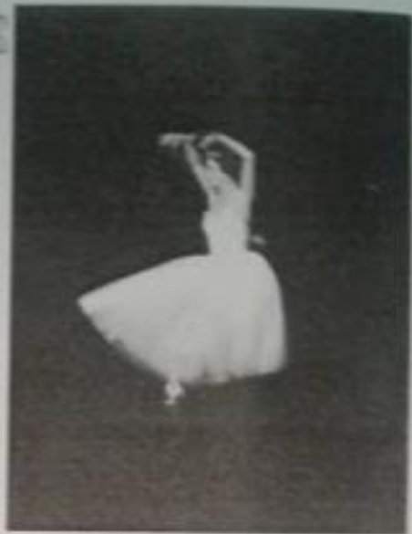
ԳԳ վաստակավոր արտիստուհի ԱՅՏԱ ՄԱՐԿԵՅԱՆ